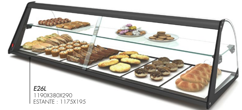
E26L 1190X380X290 ESTANTE : 1175X195