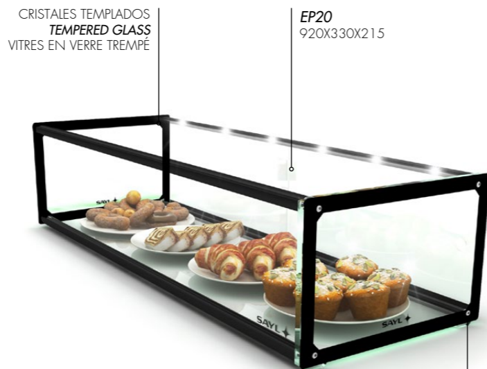
CRISTALES TEMPLADOS TEMPERED GLASS VITRES EN VERRE TREMPÉ