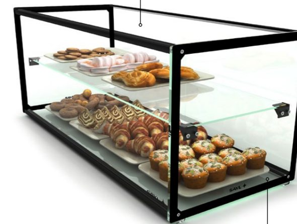
VITRINA CON LA MÁXIMA VISIBILIDAD MAXIMUM VISIBILITY DISPLAY CABINET VITRINE AVEC UN MAXIMUM DE VISIBILITÉ