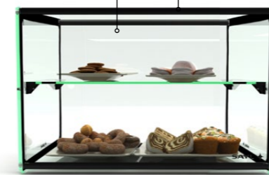
EP36 920X390X375 ESTANTE :300X900