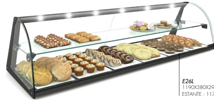
E26L 1190X380X290 ESTANTE : 1175X195