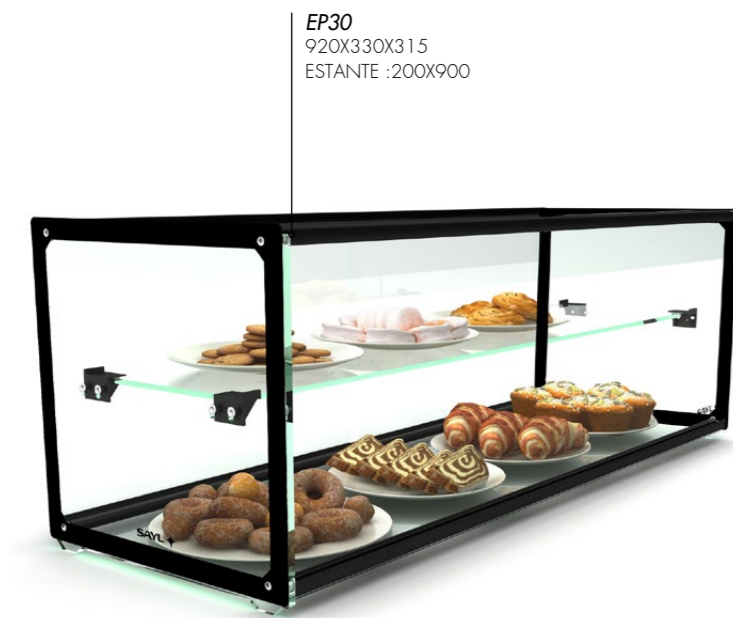
EP30 920X330X315 ESTANTE :200X900